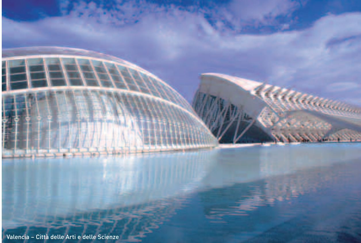
Valencia – Città delle Arti e delle Scienze