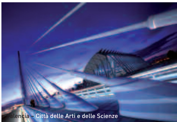
Valencia - Città delle Arti e delle Scienze