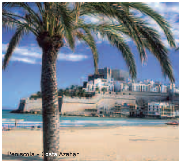
Peñíscola - Costa Azahar

Località balneari della Costa Azahar Alcoussebre, Benicarló, Benicàssim, Oropesa del Mar, Peñíscola, Vinaròs