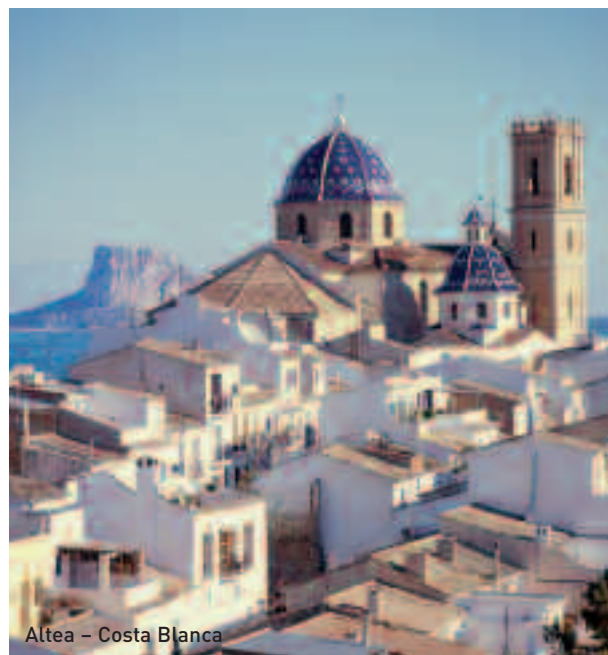
Altea – Costa Blanca

Pullman da Valencia (Vedi Trasporti, pag.13) Dall'Italia, compagnia Eurolines - www.eurolines.it